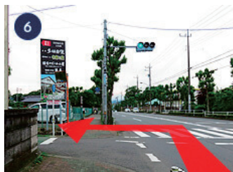
6 左手に「多満自慢」「多摩の恵」 の看板が見えたら、左に曲が ります