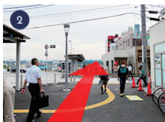
2 横断歩道を渡り、ロータリーの横を直進