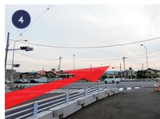
4 「武蔵野橋交差点」を直進