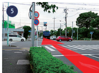
5 「内出交番前」の信号を直進