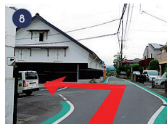
8 次の曲がり角を左に曲がる と到着！右手「多満自慢」 の看板の下からお入り下さい。