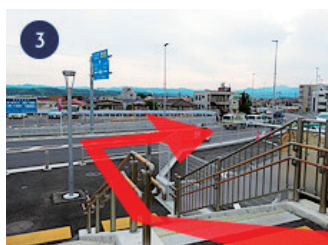
3 階段を下りて、右手に進みま す