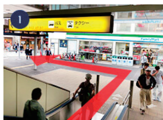
1 改札を出て右に進み、エスカレーターを降ります。(南口)