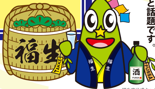
福生市公式キャラクター たっけー☆☆

たっけー☆☆もお祝いに来よう！ 会場に遊びに来よう！ 「たっけー☆☆ハイタッチ」で しあわせが訪れると話題です。